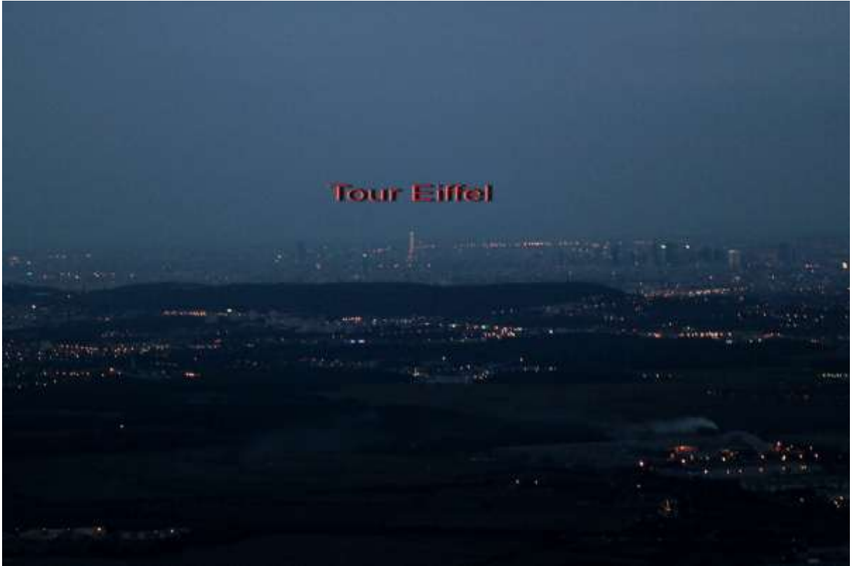
Ennery by night