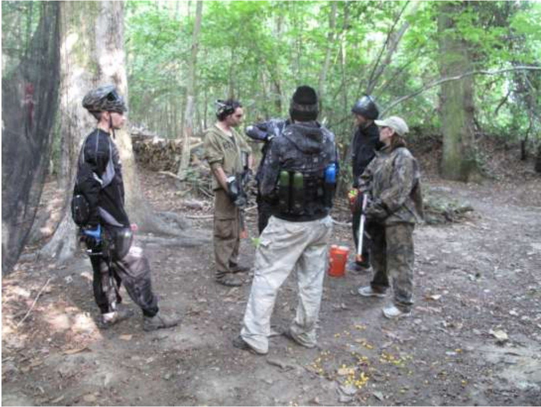
En pleine action