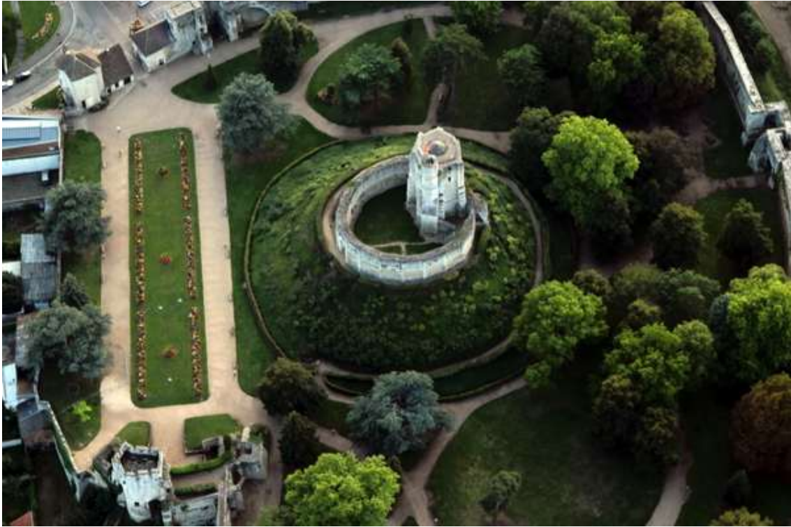
Drôle de maison isolée