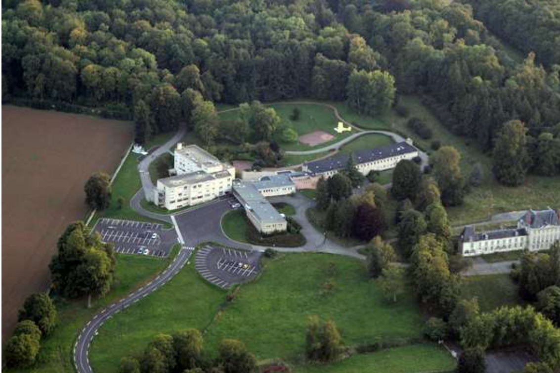
Château de Noyers

Il est super-bas cet avion, et au-dessus d'un centre de convalescence en plus !!