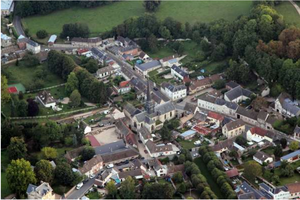
Château de Dangu