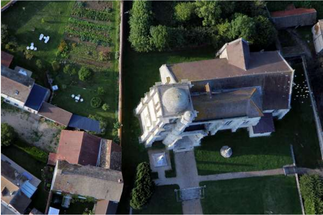
Gisors se profile