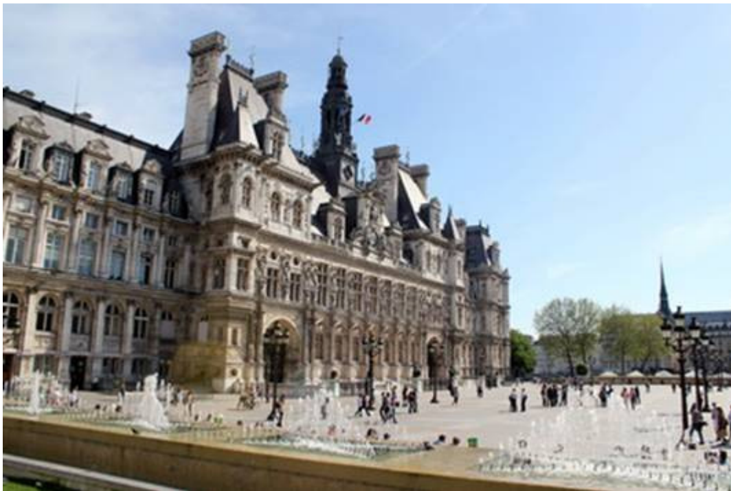
L'hôtel de ville