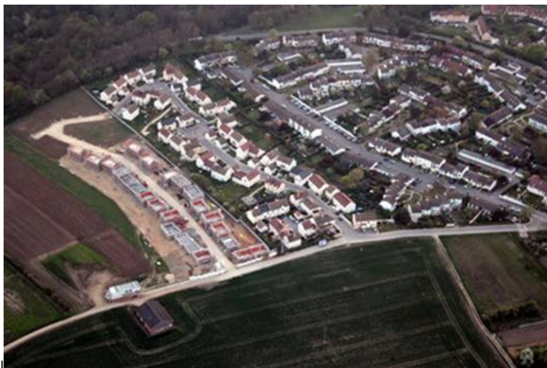
Les Baudières I et II