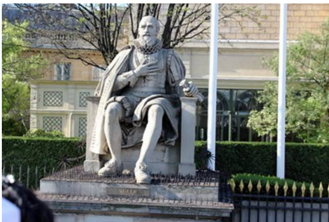
Sully devant l'assemblée ...