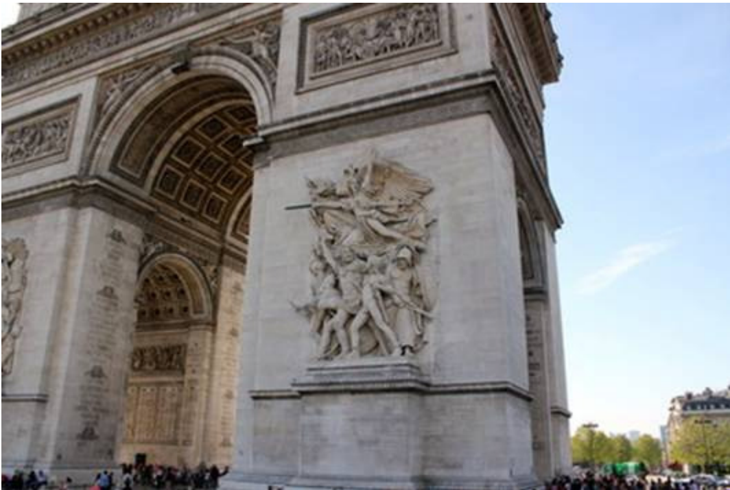
L'arc de triomphe