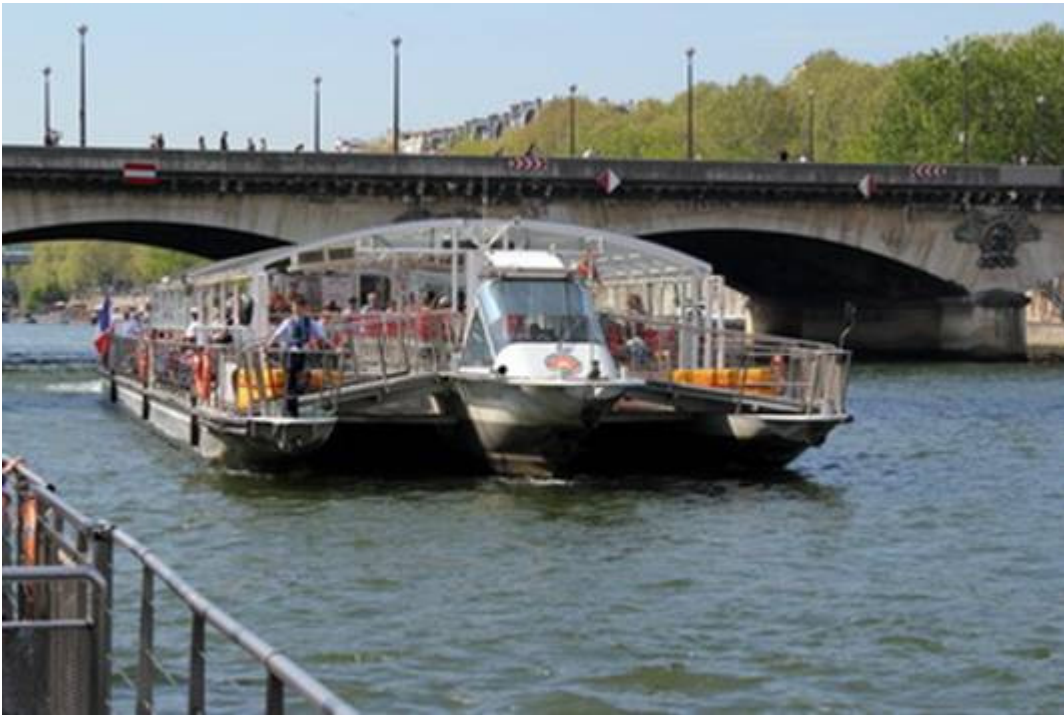
Notre bateau mouche