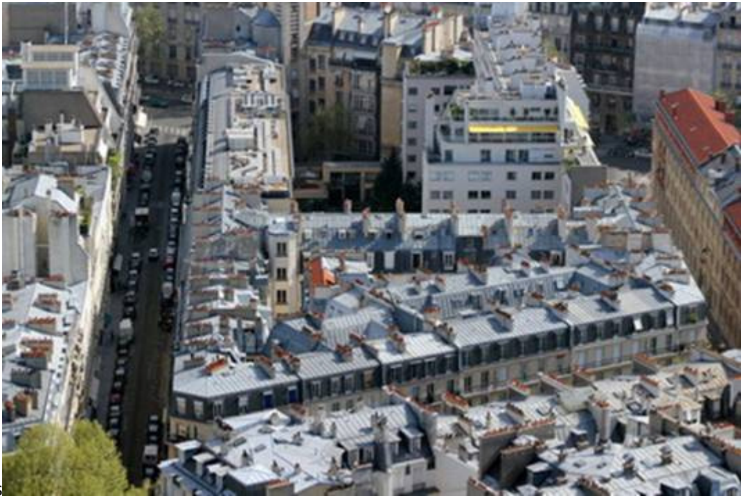
Les toits de Paris