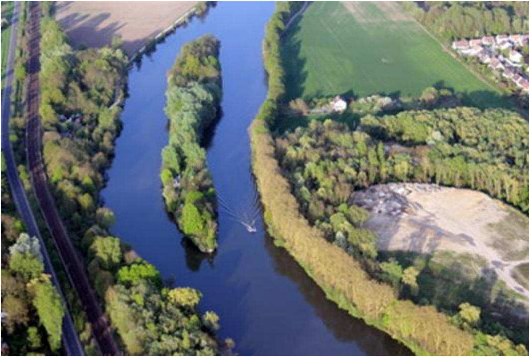
Ste Geneviève : bonjour Babeth