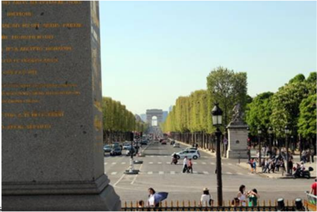
Les champs Elysées