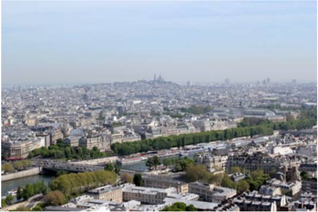
Vue sur Montmartre