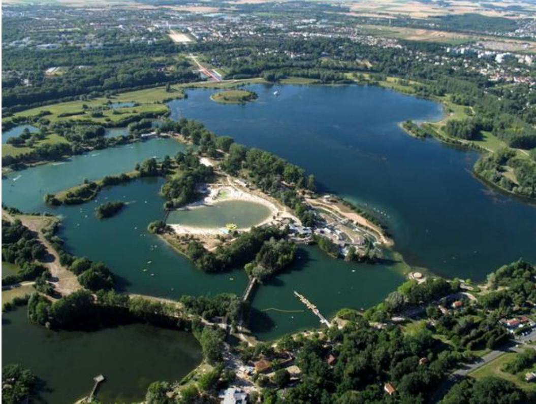
Les Muraux : la piste Dassault