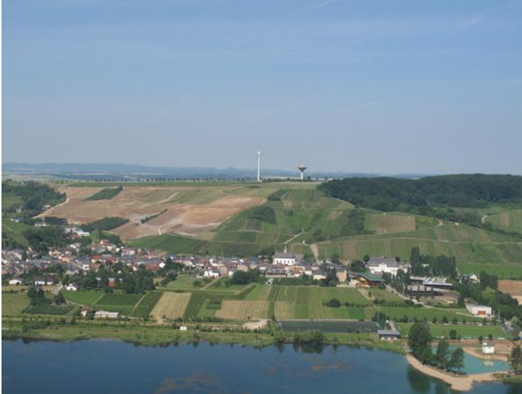
Nous revoilà en France