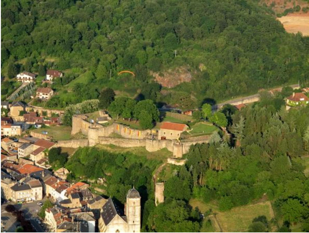
Au loin, la montgolfière