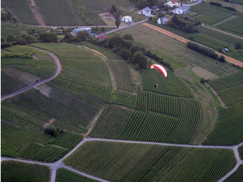
Une petite pointe de vitesse