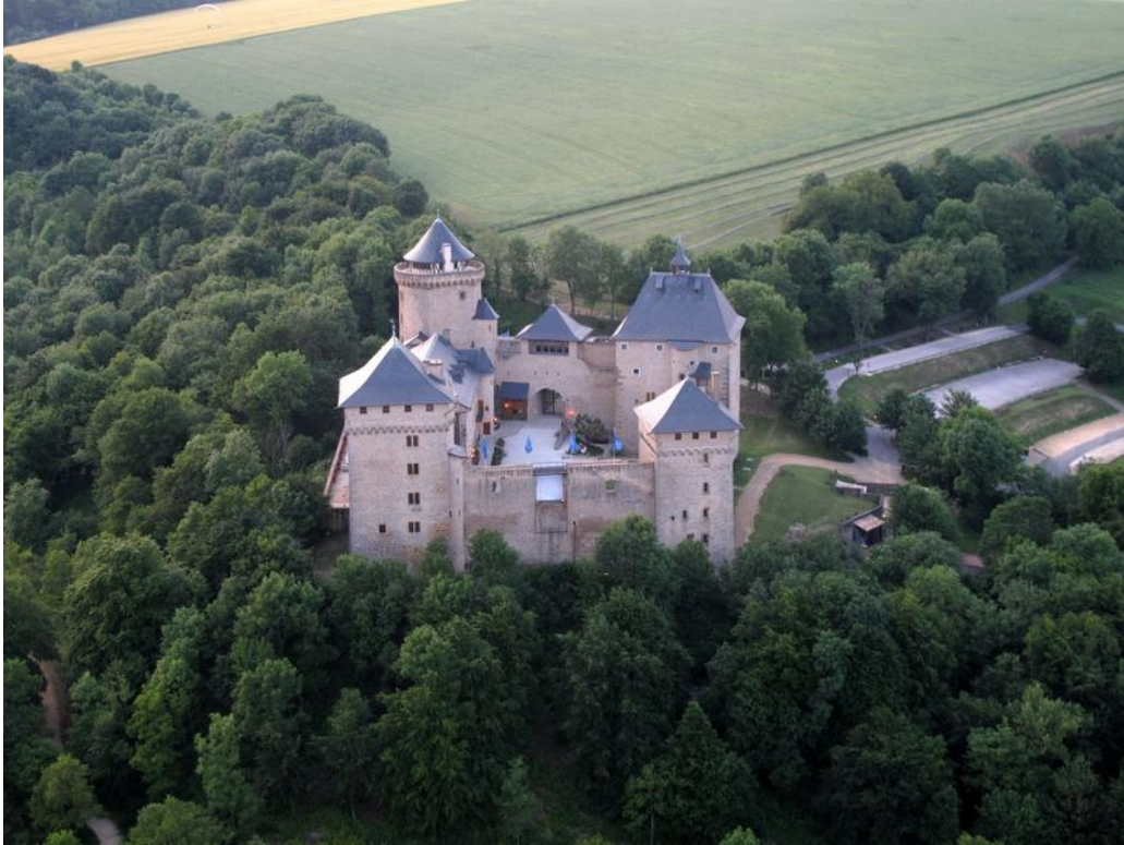
Le soleil baisse : on va rentrer