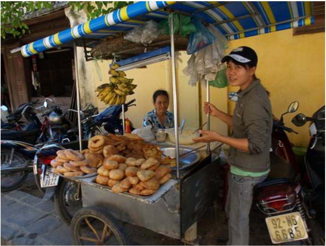
Des repas typiques