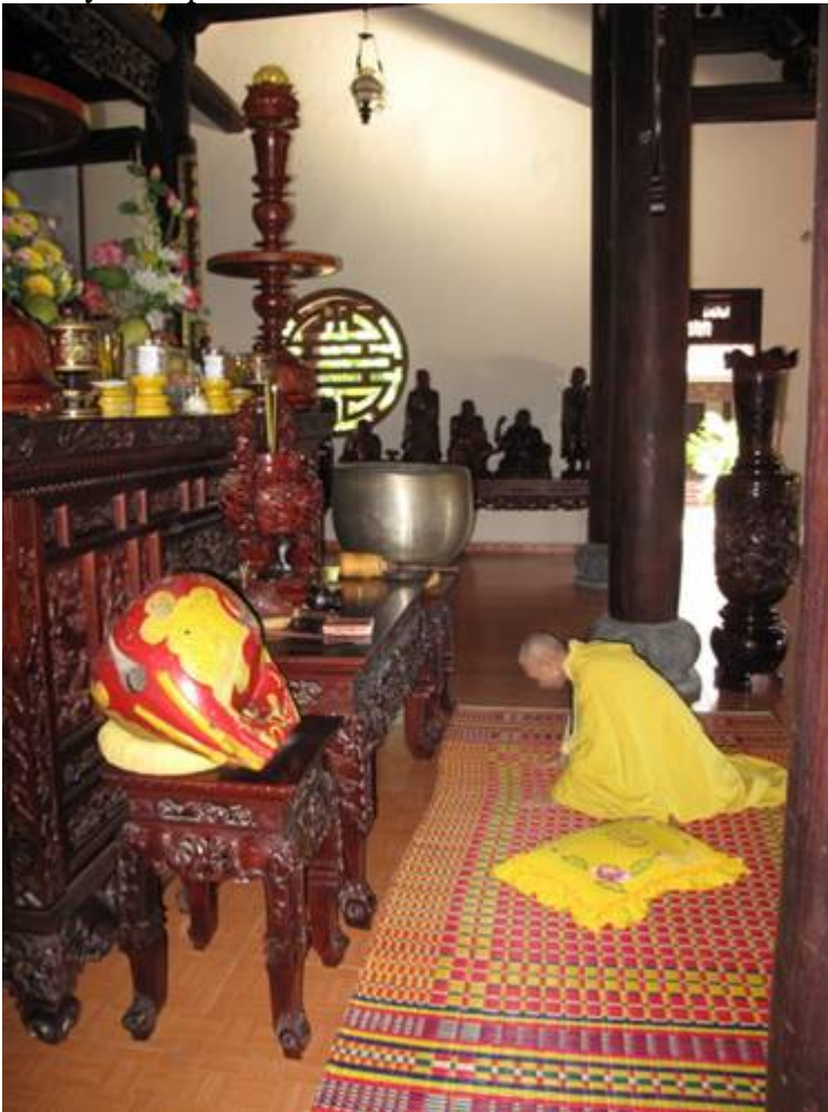
Un bonze répond à nos questions