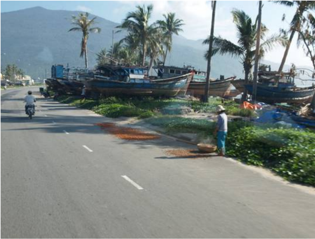
D'autres bateaux, échoués ceux-là