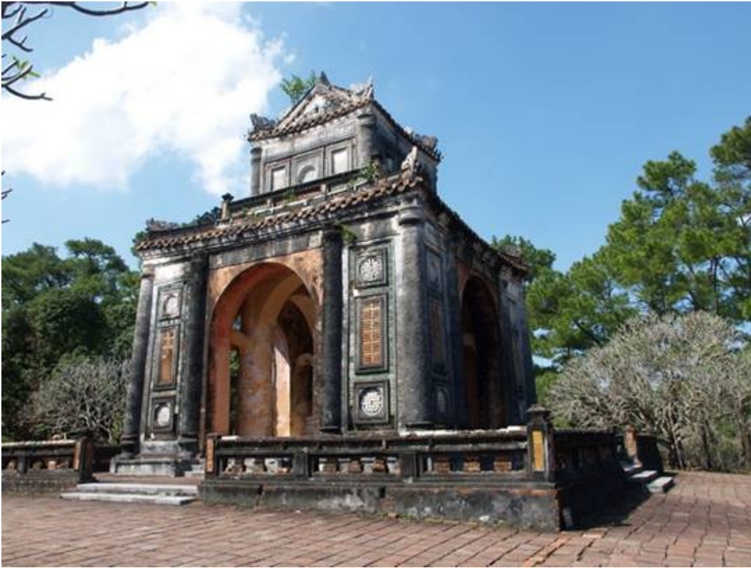
La cité impériale et la cité interdite