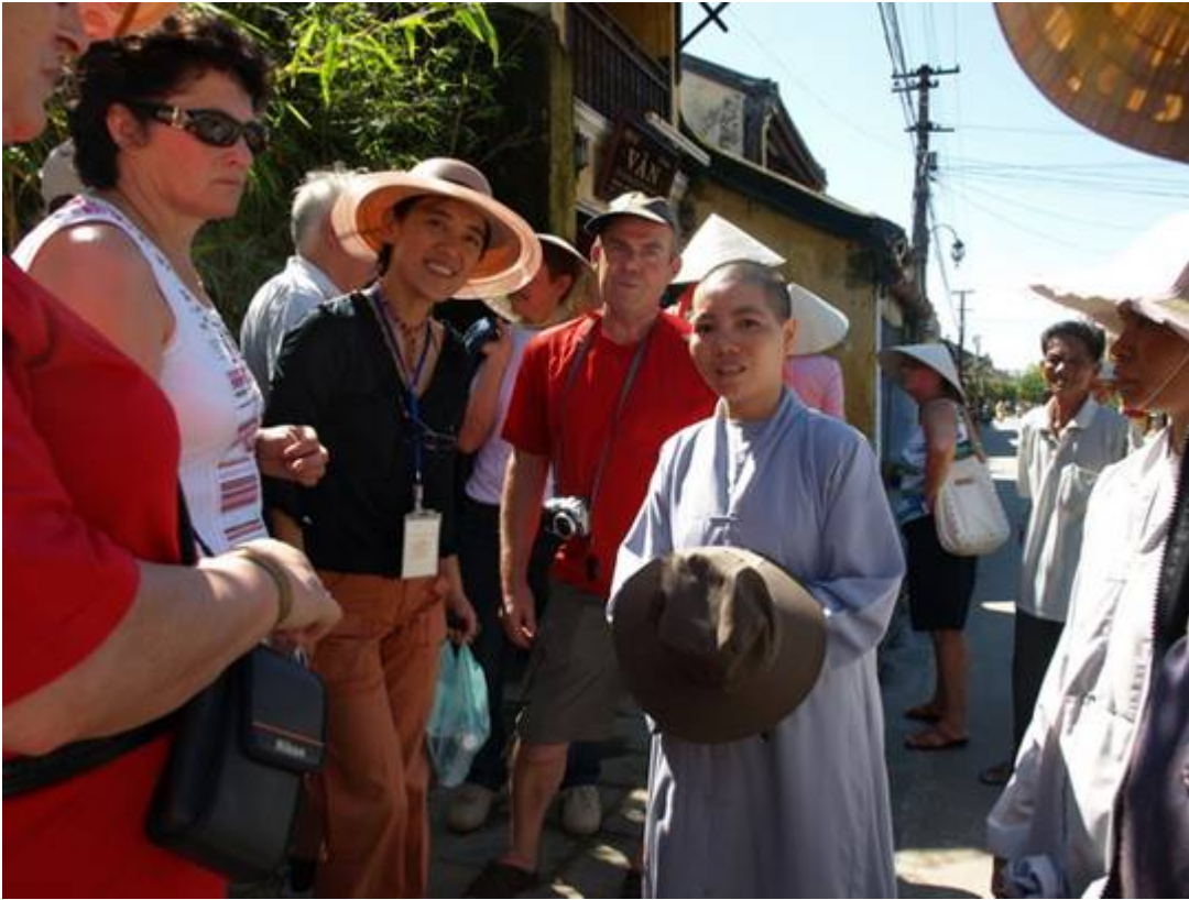
Visite de la Pagode