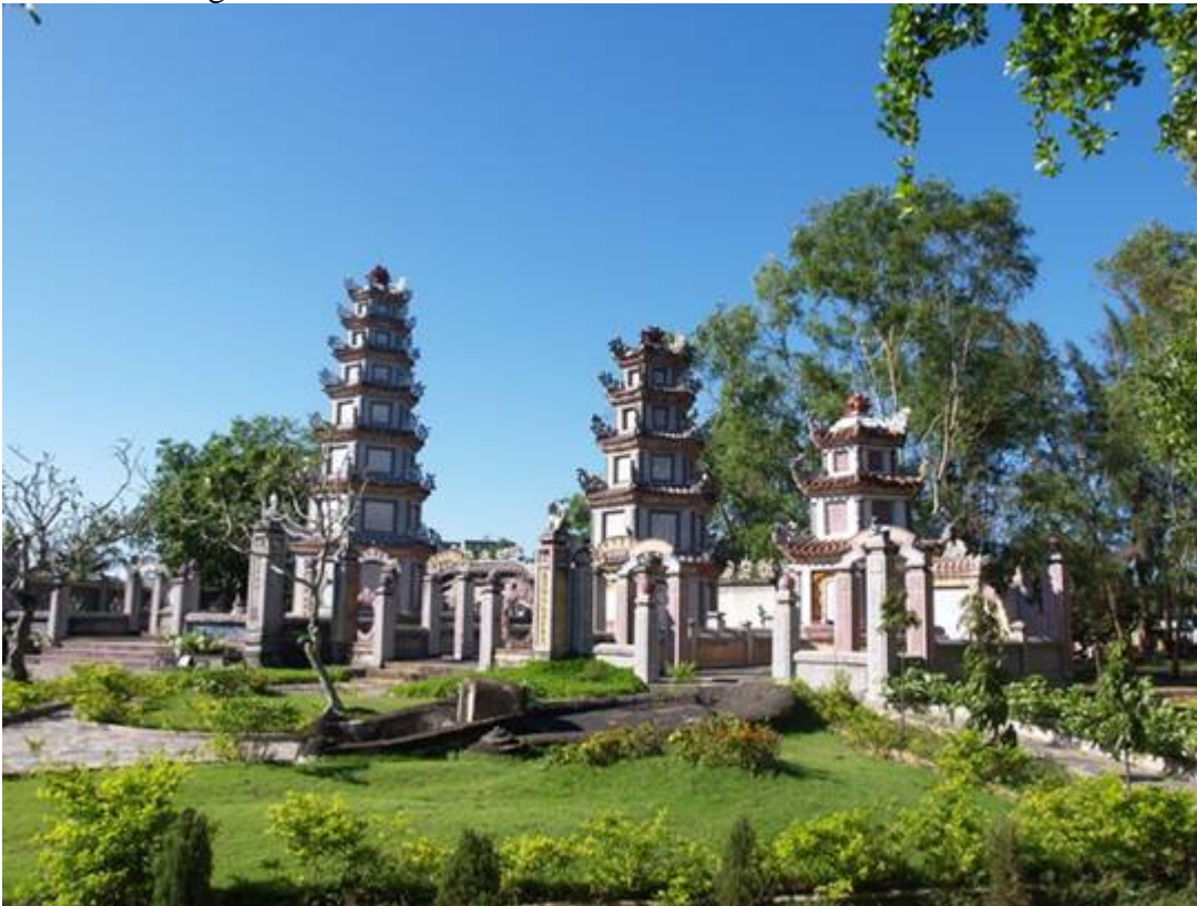
La salle de prières