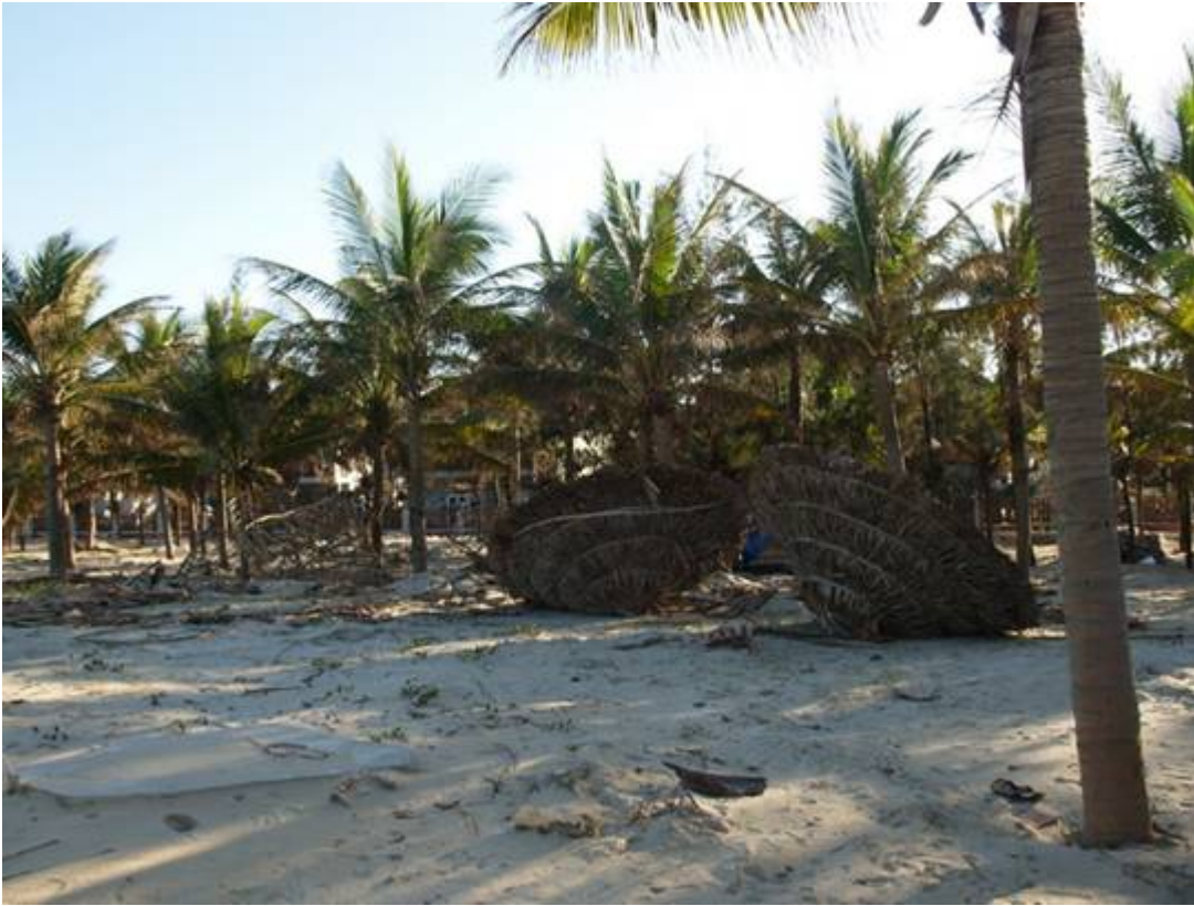
Maisons, pancartes .... arrachés