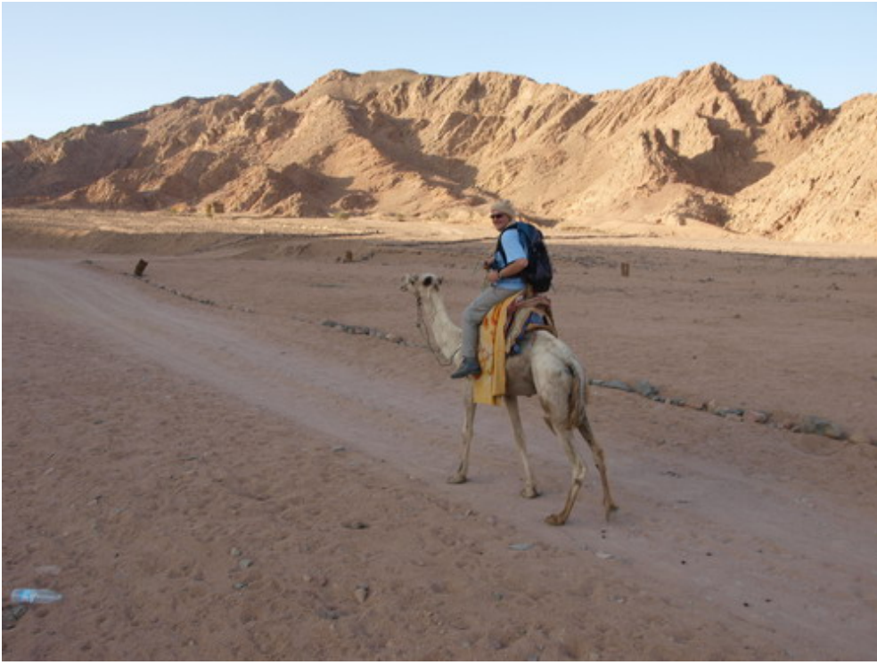
Dans la montagne