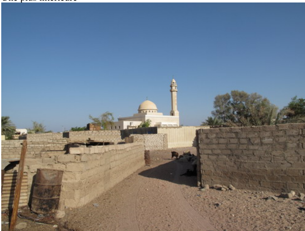
On est invité chez le guide pour un thé