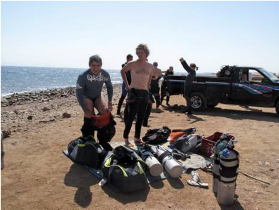
Pas mal la station de gonflage JPierre, Pierre & Cie