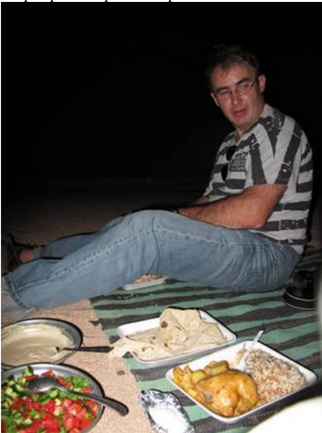
Quelques photos de moi faites par Michel :