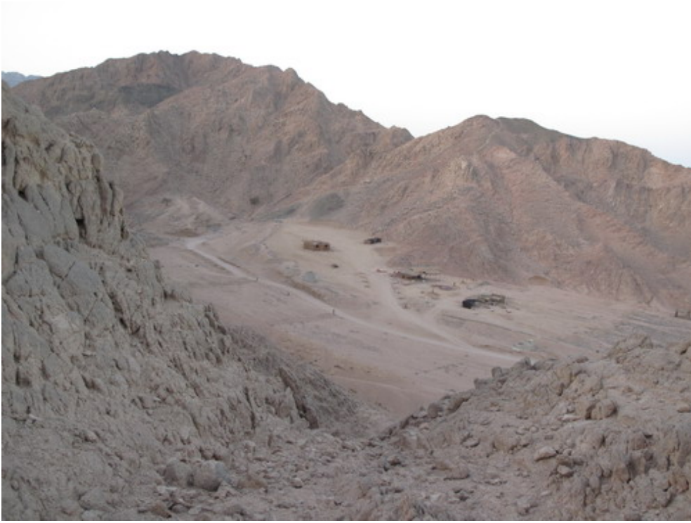
Un peu plus bas pour un repas bédouin et une observation des étoiles