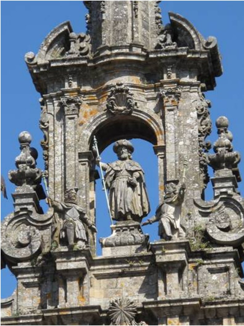
Pour finir : photo sur la place