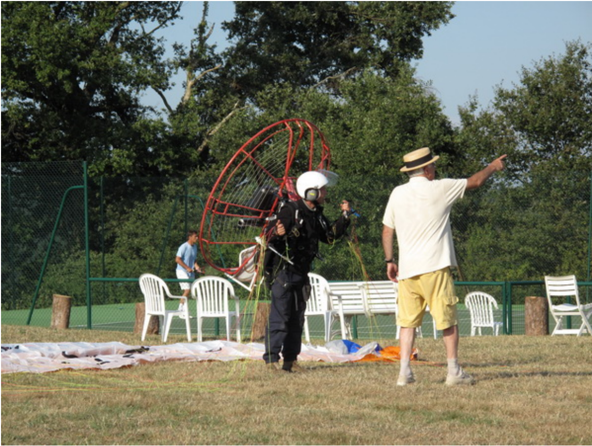
Etpes dans des lieux enchanteurs