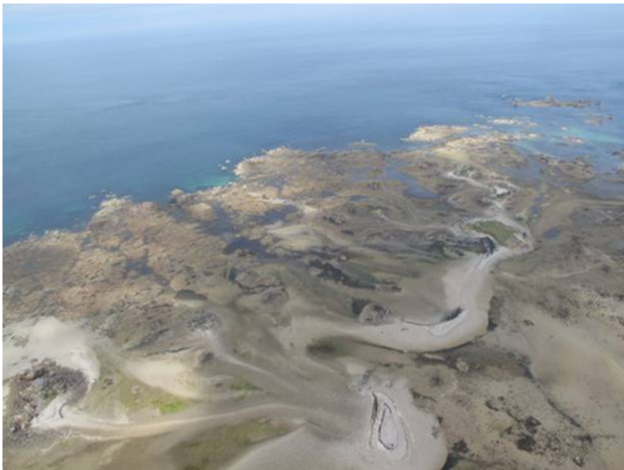
Le phare des hauts de Bréhat