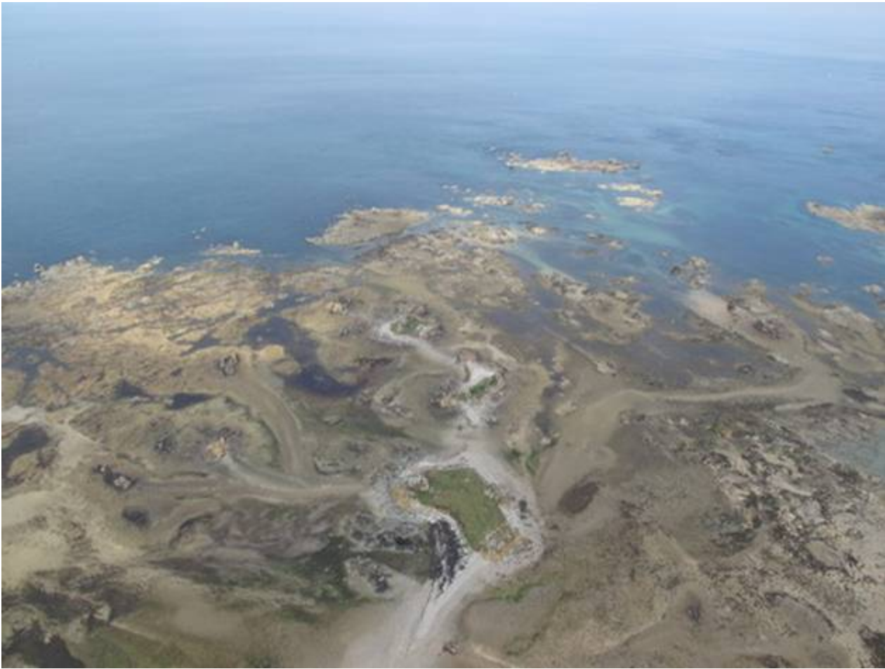
La côte Nord de la baie : avec Plougrescant et la pointe du château