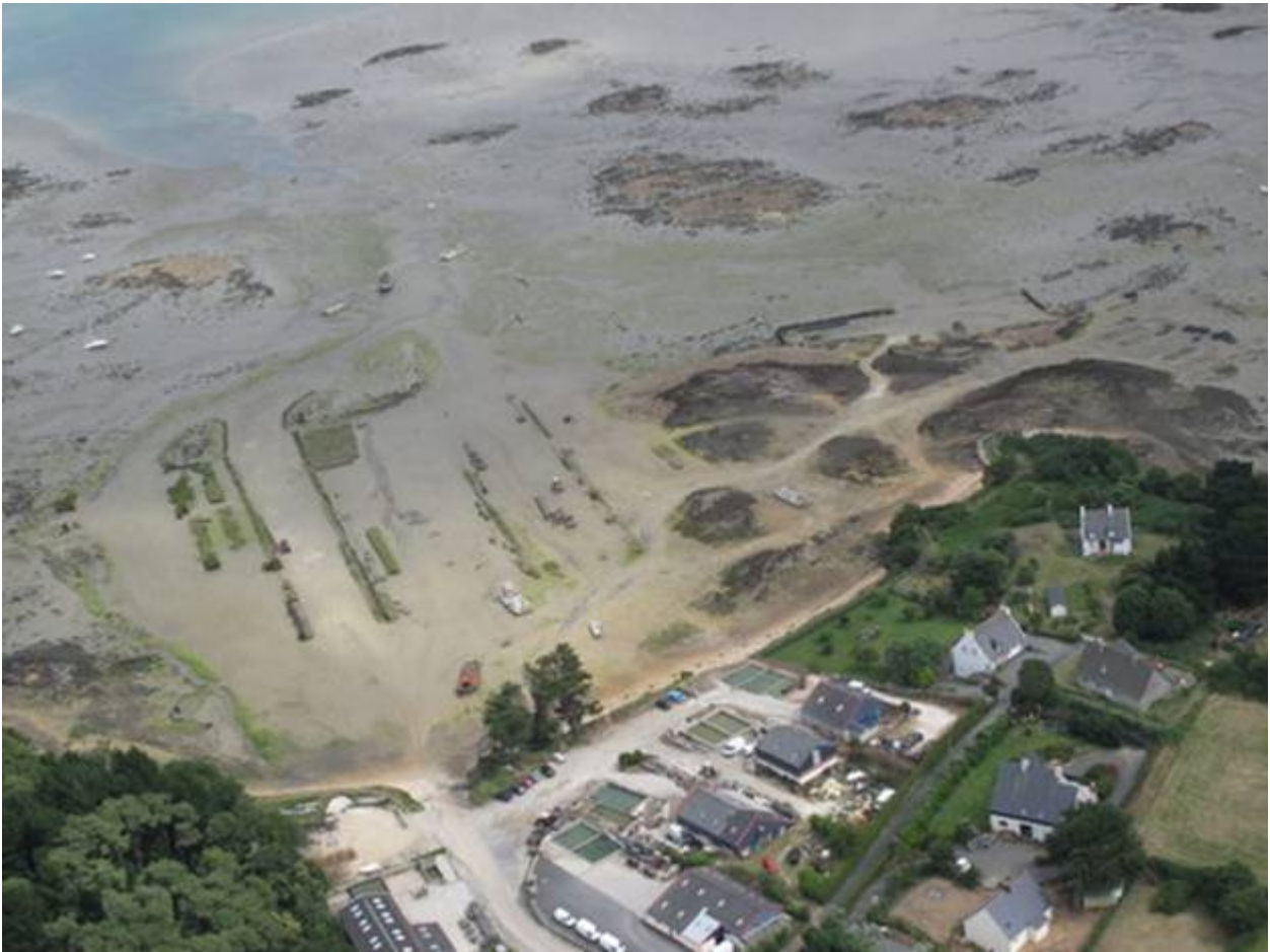
Arrivée vers le sillon