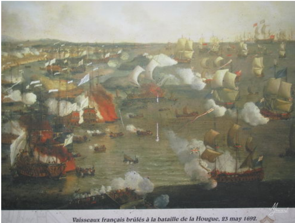
Vaisseaux français brûlés à la bataille de la Hougue, 23 may 1692.