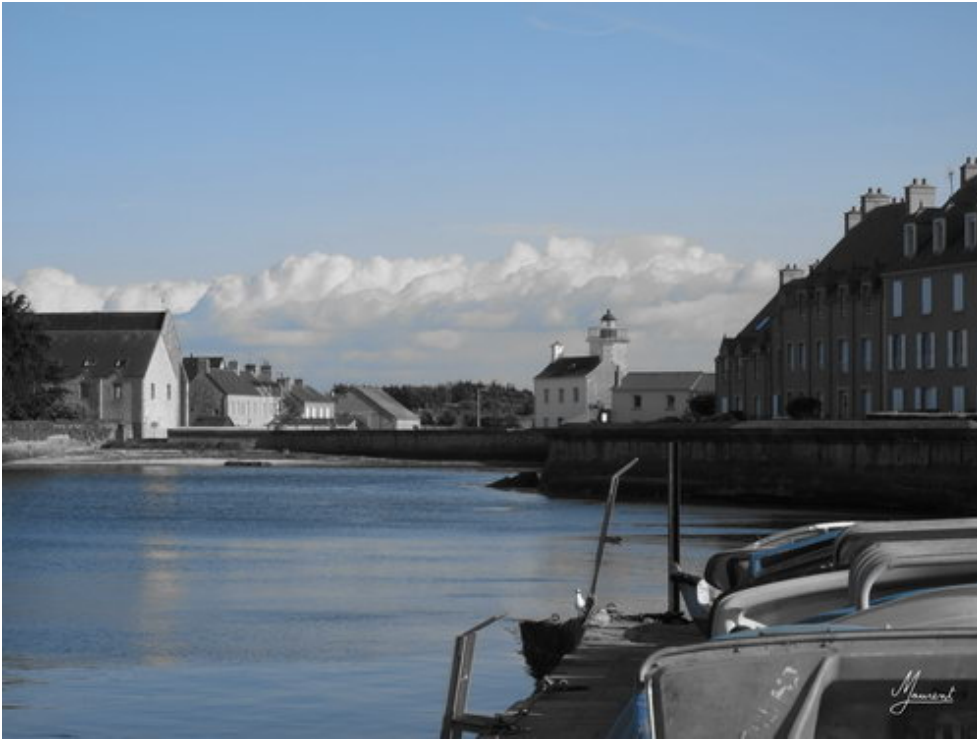
Fin de journée