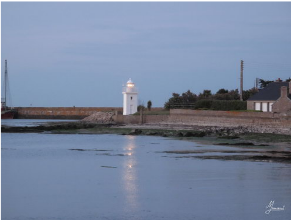
Dimanche : Saint VAAST de la Hougue