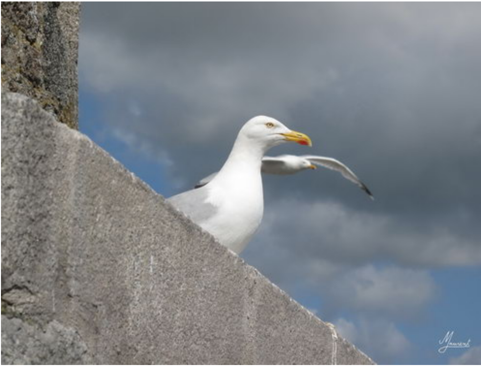
Fortifications du fort