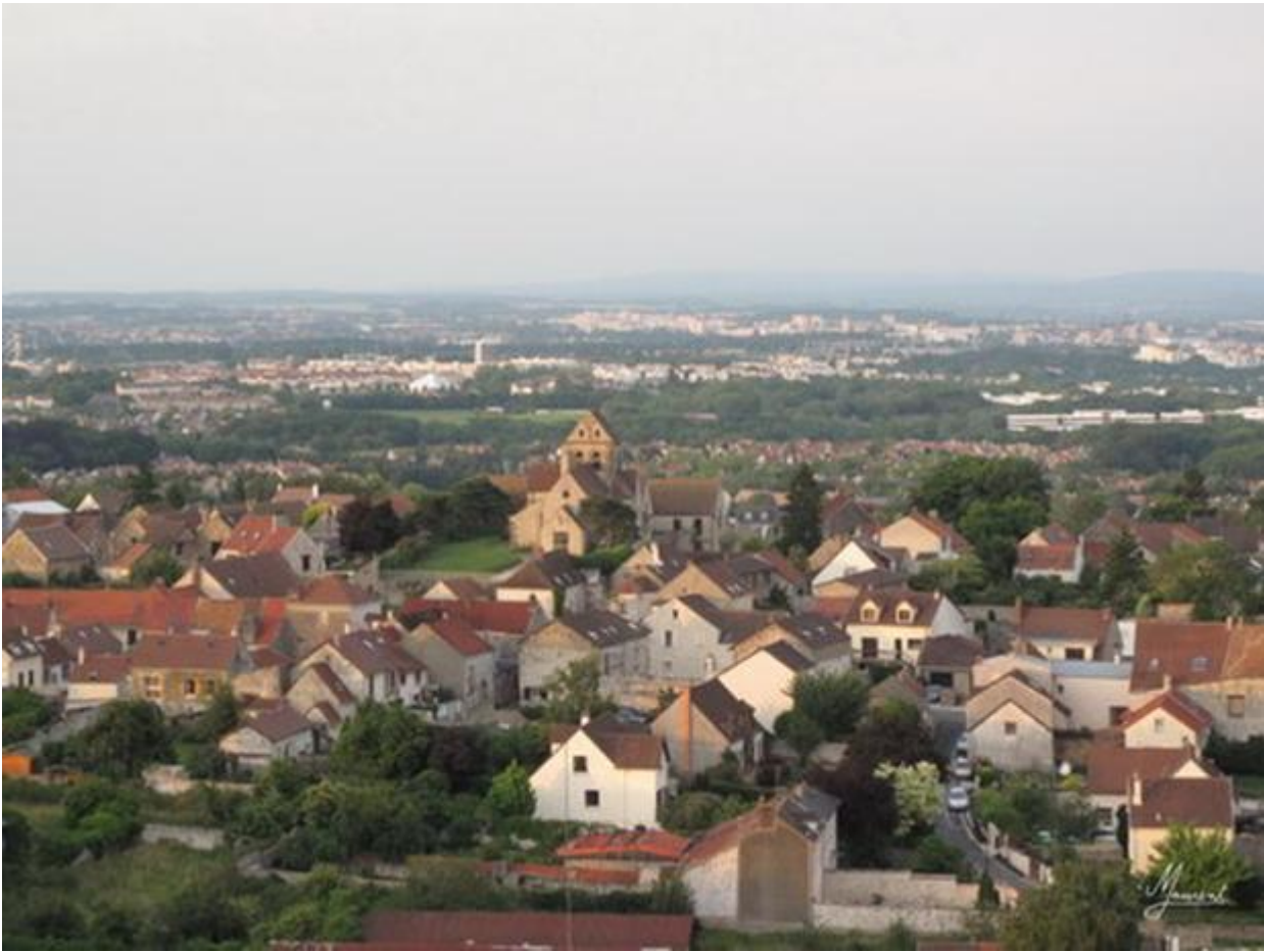
Et son château d'eau