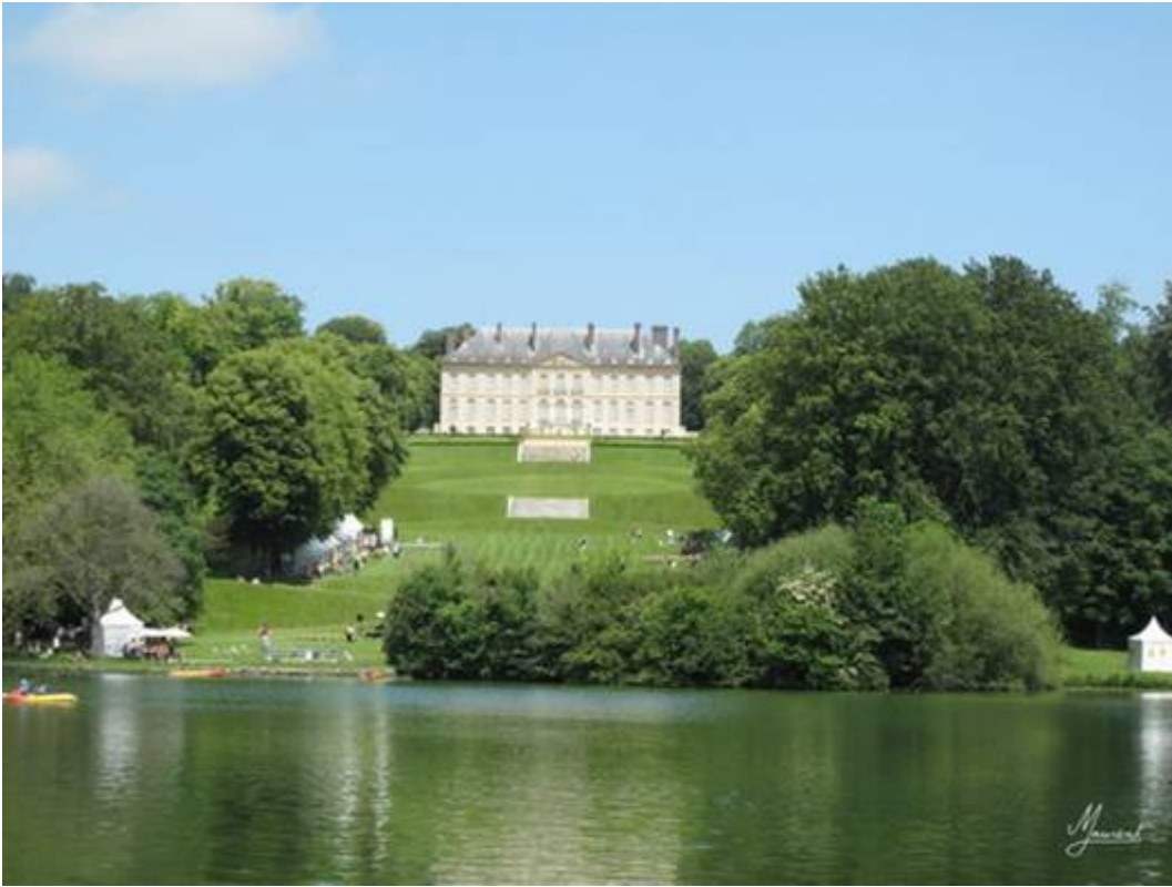
Vue aérienne pour vous donner une idée du domaine