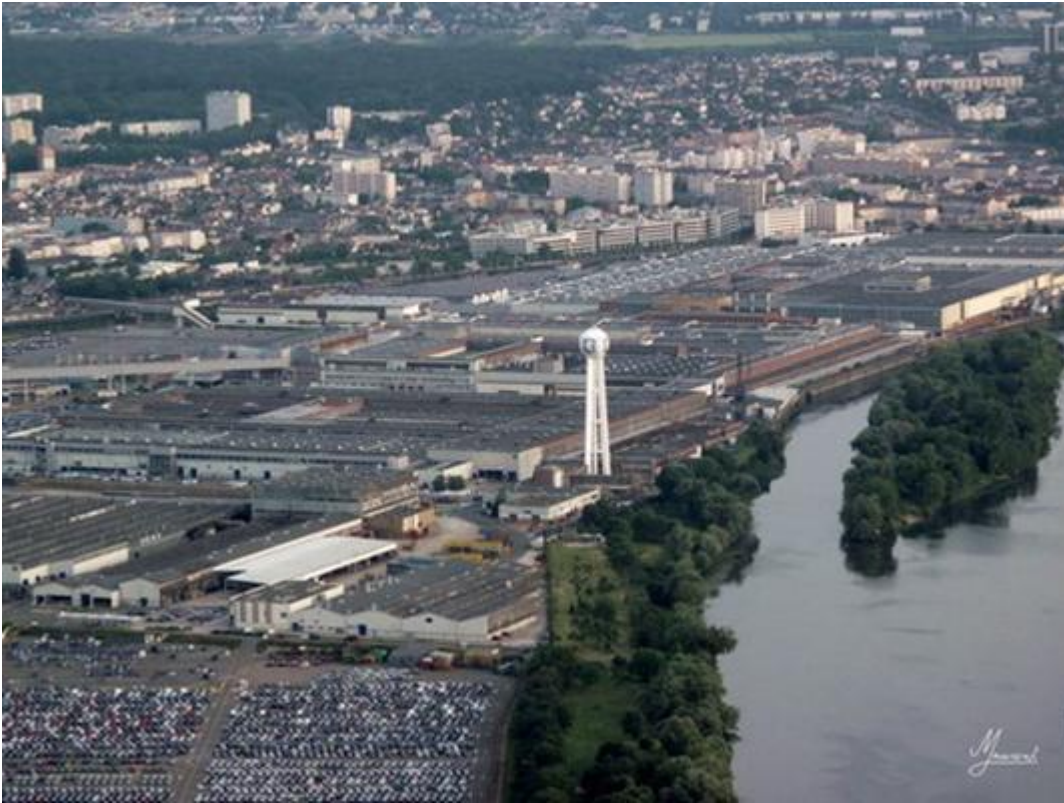
Les boucles de la Seine