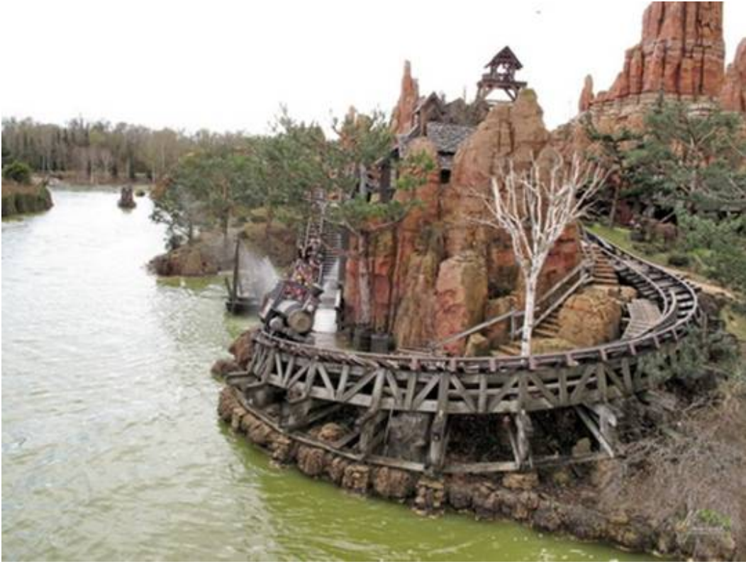
Bizard y a personne ???