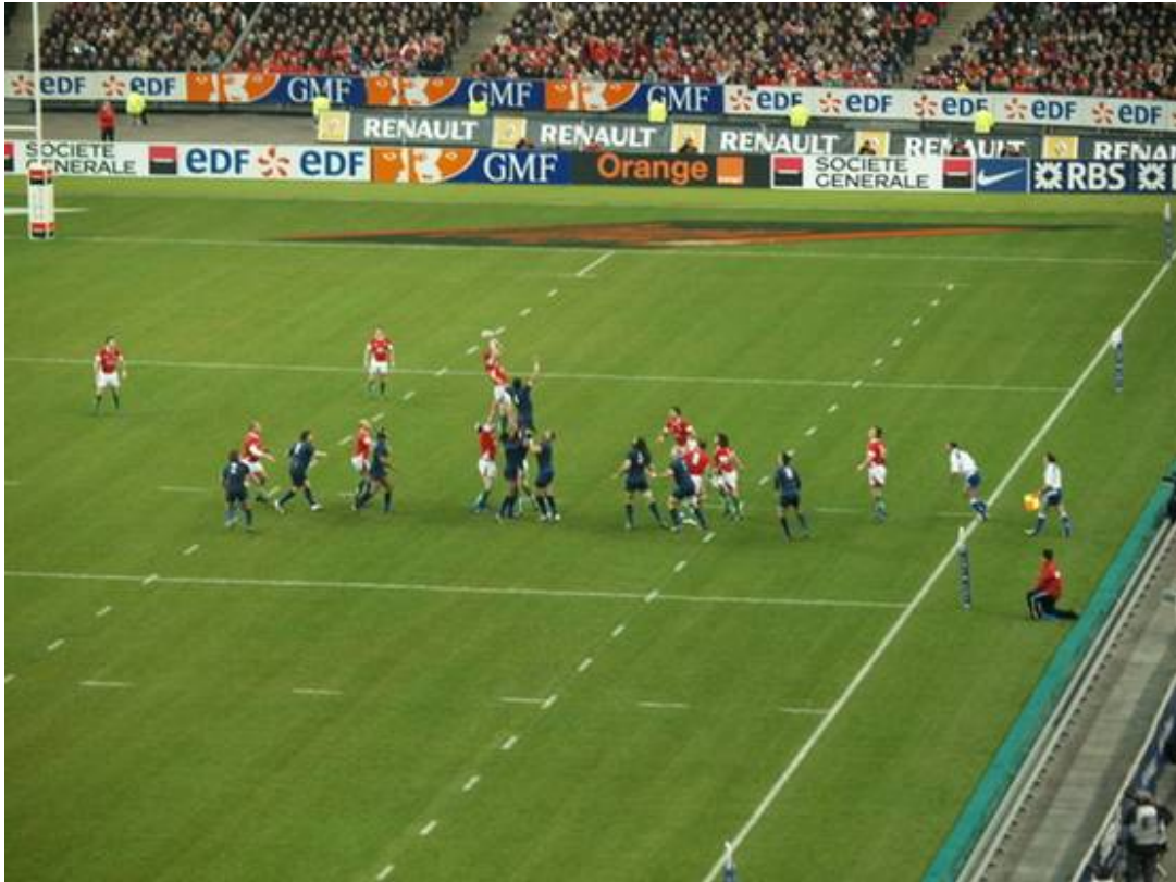
Et hop 3 points pour les Gallois