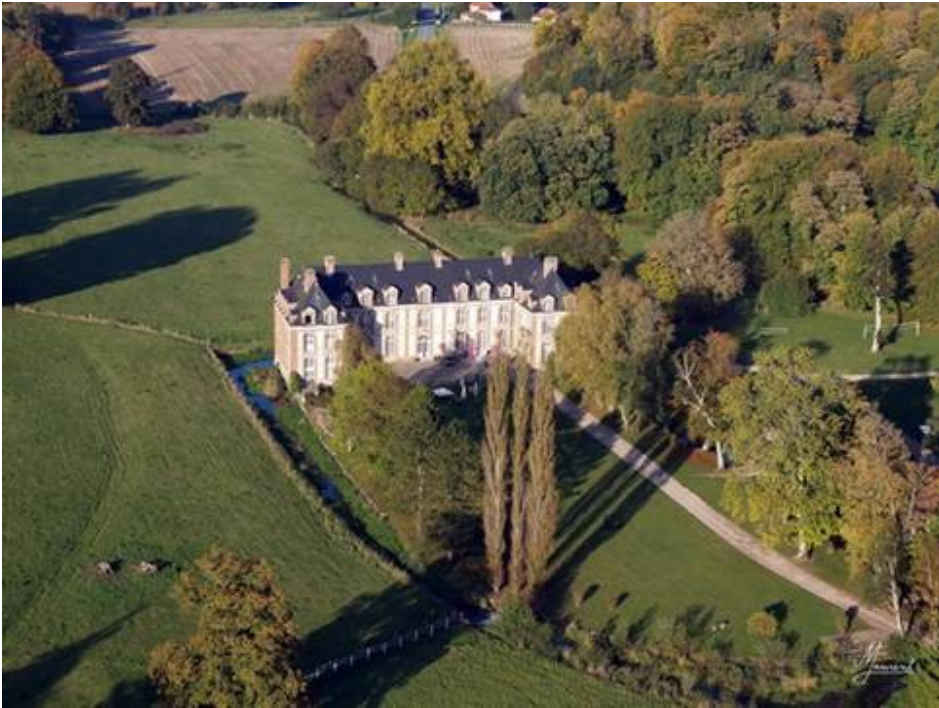
Retour sur Lyons