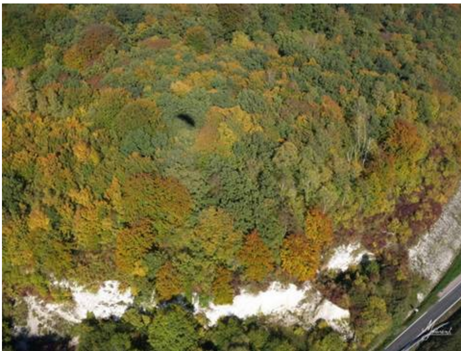
En arrivant sur Vascoeuil