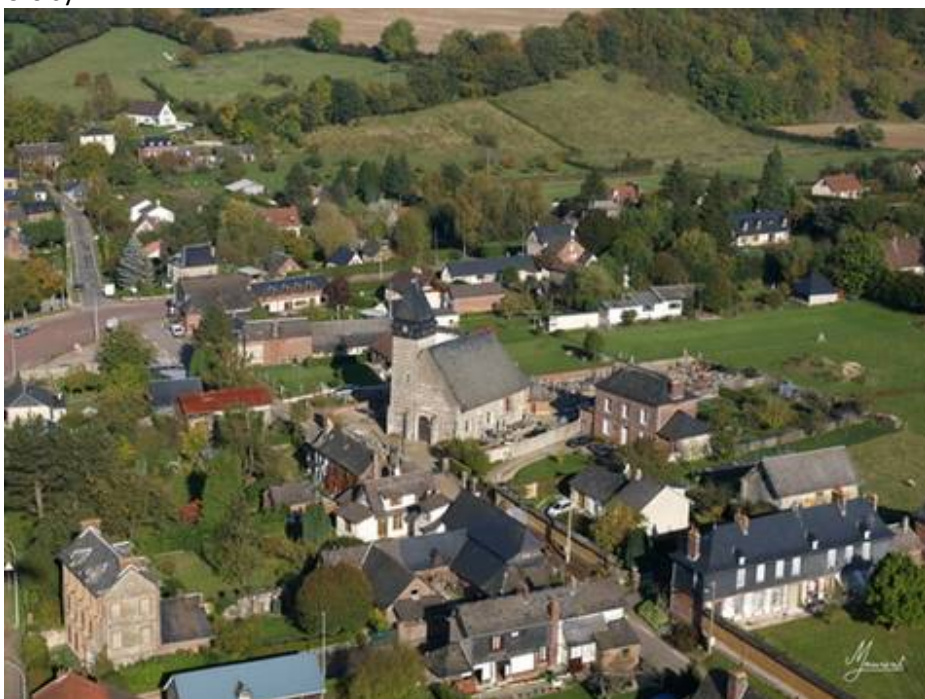
On croise des truc étranges