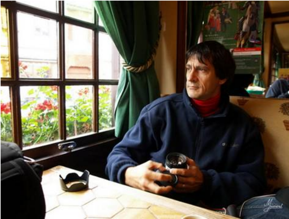
Lyons est belle, même au sol, en attendant que cela se lève