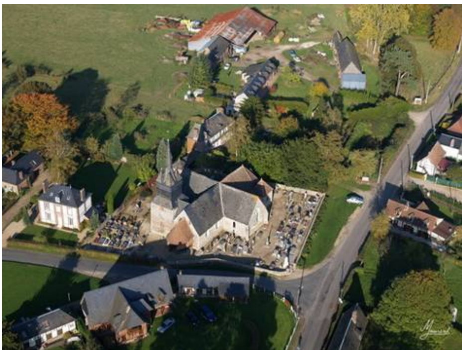
L'abbaye de Mortemer