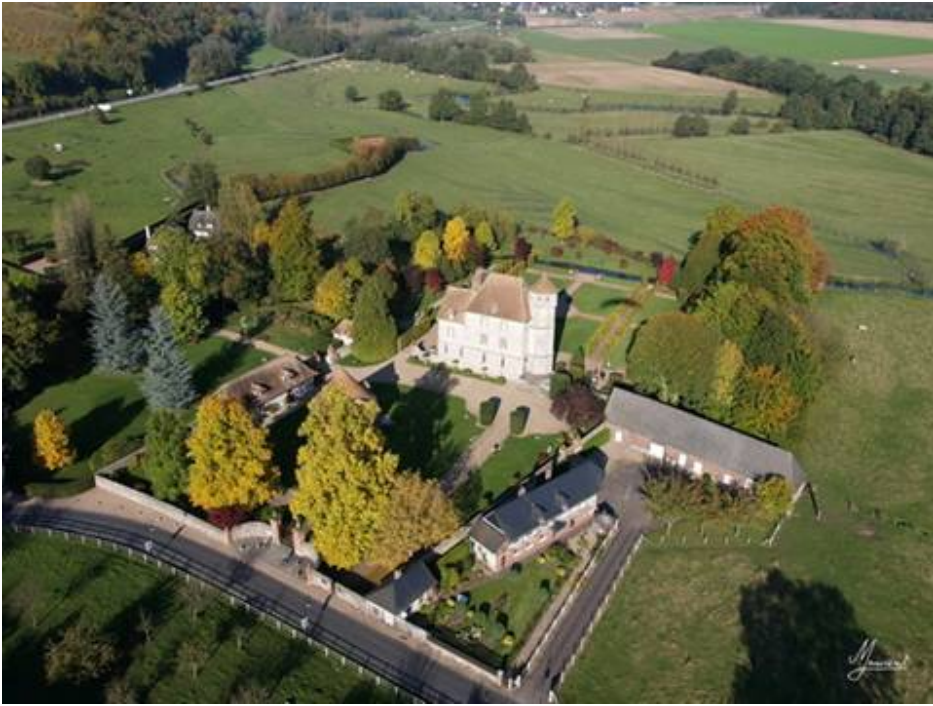
Marrant de jouer avec les ombres