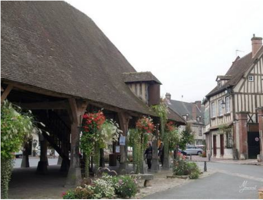
C'est mieux vu d'en haut