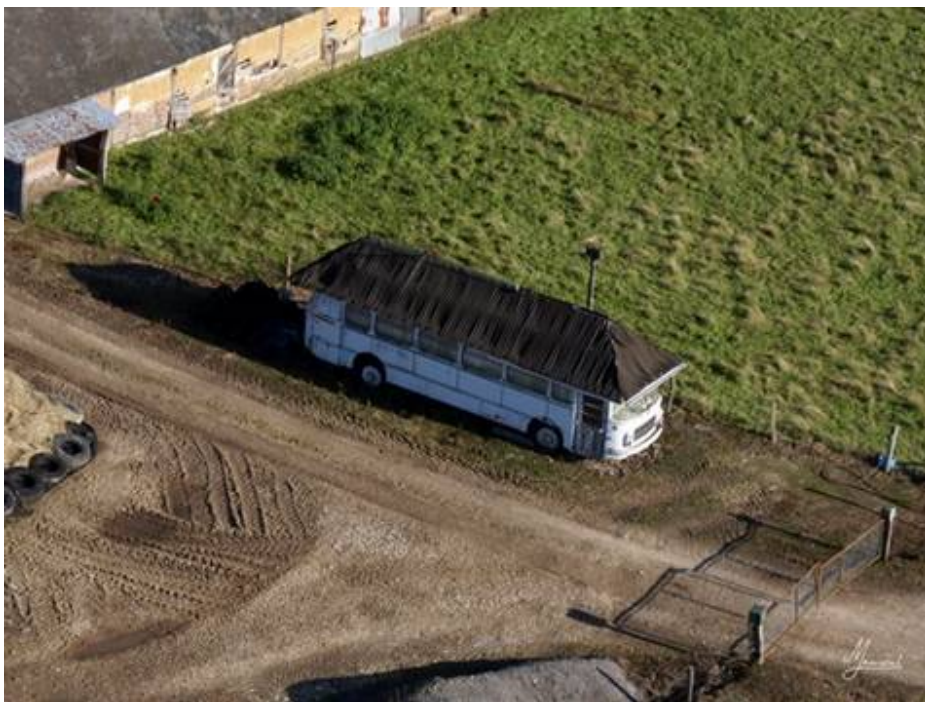
D'autres plus locaux