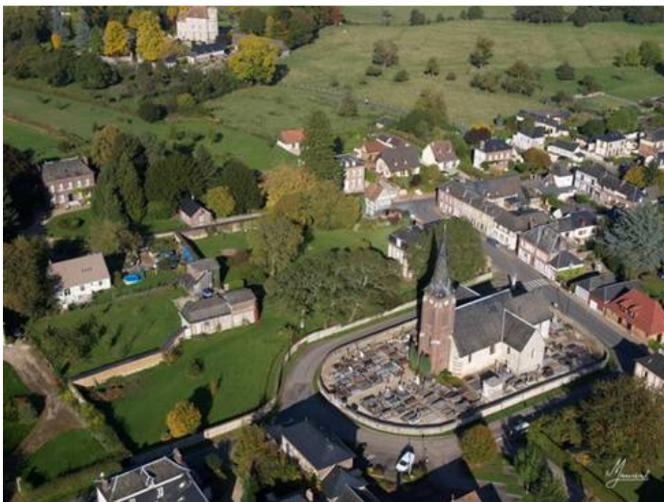
Le château de Vascoeuil