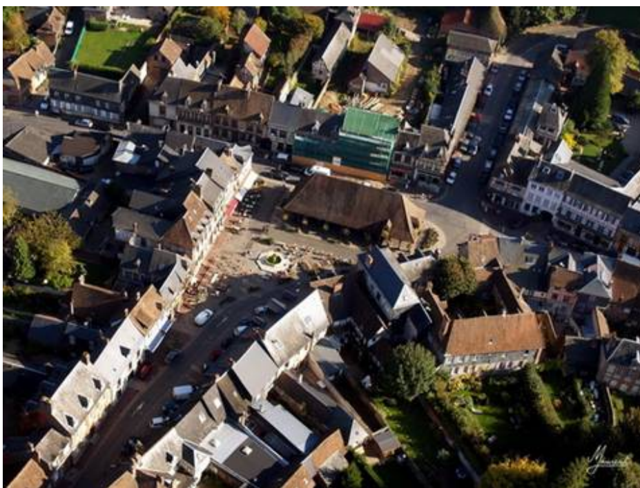
Les couleurs sont superbes en cette mi-October